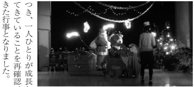
サンタさんの登場

紙テープを長くつけたものを用い、走ることに伴って風や紙テープがヒラヒラなびき、目に見えない不思議な風が吹きます。