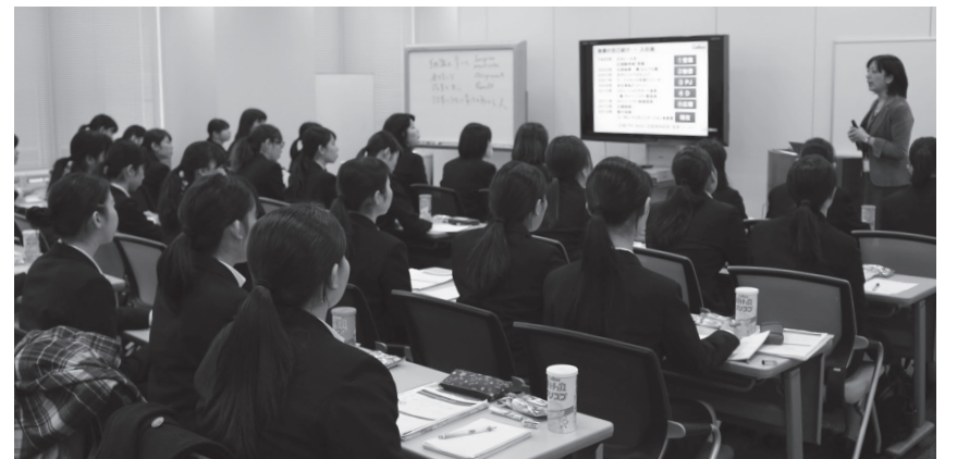
真剣に耳を傾ける学生たち

講演会終了後は学生から多様な質問が飛び出し、予定時間をオーバーするほどの活発な質疑応答が繰り広げられました。最後に本社内のオフィス見学を実施。「働く」現場を間近で見ることができ、貴重な機会とあって、学生たちは興味深そうに見入っていました。