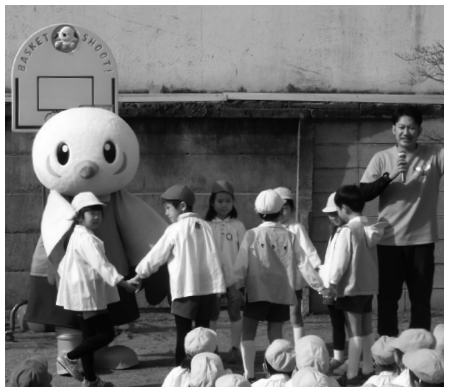
「ゆりーと」と一緒に

ゆりーとが来ることを知った園児たちは、「いつ来るかな?」「ゆりーとって何だろう?」と、当日を楽しみにしていました。