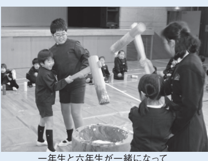
一年生と六年生と一緒に

通常、横割りの同学年・同年齢の集団で活動が行われます。そこでは、公平であることや基準とすべきものなどを学ぶことができます。しかし、社会に出れば、そこは異年齢集団の場です。誰もがすべて同じようになれるということ、ほとんどありません。社会に出てからは、お互いを思いやることこそ大きな力になります。