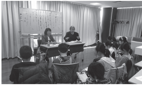
長江所長囲み取材(新聞記者体験より)

プロから学ぶお仕事体験は全十五種類。学内からは「新聞記者」「パティシエ」「音楽療法士」「幼稚園教諭・保育士」「建築士」「心理カウンセラー」「管理栄養士」「医者」「グラフィックデザイナー」「鉄道職員」「エンジニア」「キャビンアテンダント」「弁護士」「百貨店の仕事」のプロにご協力いただき、学生とともにプログラムを作り上げていただきました。