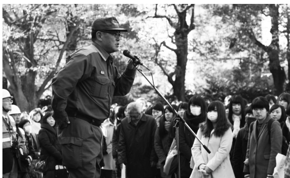
内川松戸中央消防署副署長によるお話

松戸キャンパスでは、全員が短時間で安全に避難することができるよう、毎年聖徳大学消防・防災総合訓練を全学的に実施しています。