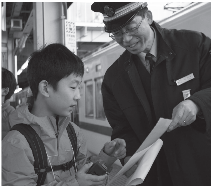
構内アナウンス体験(鉄道職員体験より)

また、体験前には子どもたち向けに「なぜ働くのか?」について考えるワークシヨップを行い、体験後には一堂に集結し、学生主導で「仕事について」のふりかえりを行いました。