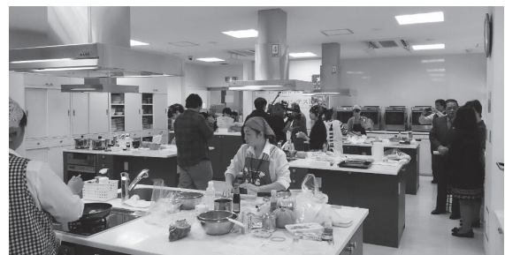
コンテスト本選の様子

て、それぞれオリジナルのレシピを考えました。そこから事前審査で選ばれたトップキング部門七名、スイーツ部門七名の学生が、十二月二十日(日)に京葉ガススタックキングスクールで開催された第五回コンテストの本選に臨みました。