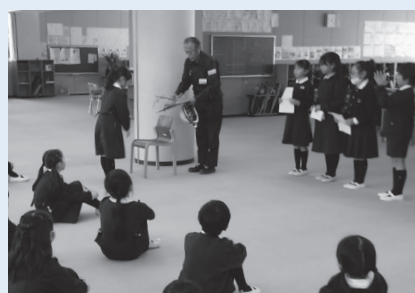
守衛さんにプレゼント

聖徳大学附属小学校では「勤労感謝の日」にちなみ、学年ごとに日々の感謝の気持ちをお世話になっている方々にお伝えする集会「感謝の集会」を行っています。 三年生は、毎日子どもたちを笑顔で迎え、送ってくださる守衛さんをお招きして集会を開きました。守衛さんの自己紹介の後、質問タイムに入ります。「いつも何時まで働いているのですか」「鍵は何本持っているのですか」など、たくさん