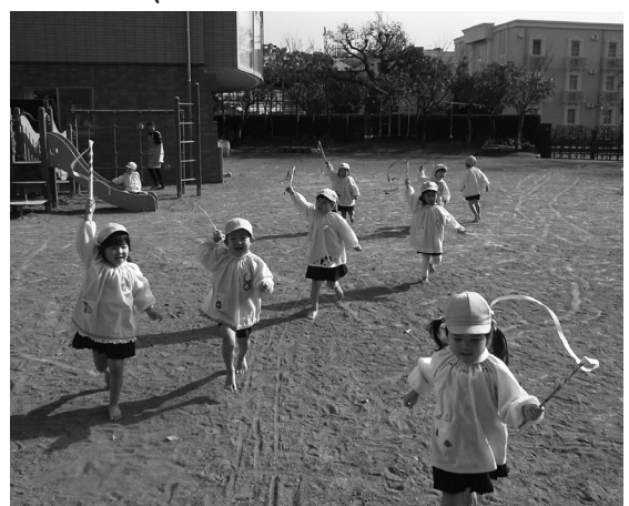
寒い中でも元気いっぱい

浦安幼稚園の二階のテラスからは、東京湾を航行する大型船やコンテナ船を望むことができます。冬の天気が良く空気が澄んでいる