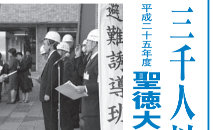
避難状況の報告を受ける災害対策本部長