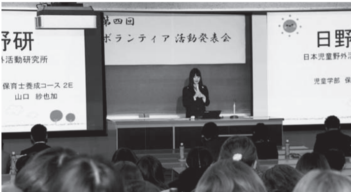
学生による発表の様子

授業後の学生の感想には、「先輩の話をうかがって、これからすぐにでも学級通信を作りたいと思いました」「保護者対応のロールプレイをしました。保護者への対応はいままで不安に思っていました。なんとかやれそうな気がしてきました」というものがありました。