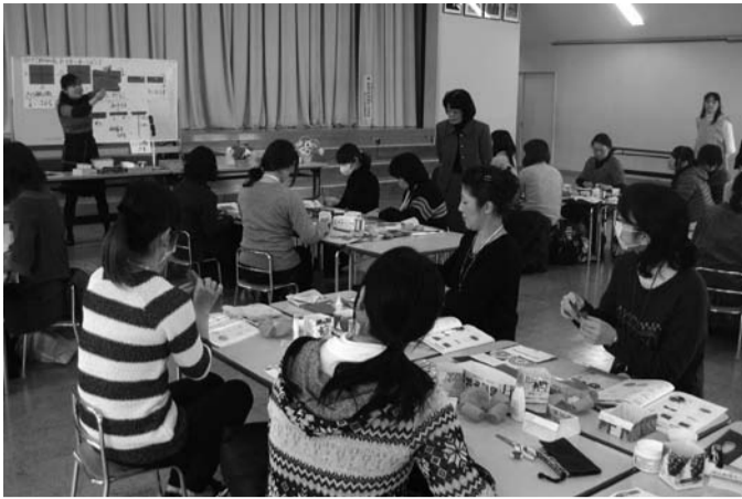
さくら紙あそびは、今年度2回目です

本園のホールにて実施しました。子育て支援センターとして、幸せな家庭を目指す子育て支援講座を年間八回開催しており、幼稚園を開放して保護者同士の交流を深めたり、育児情報を提供する場になっています。