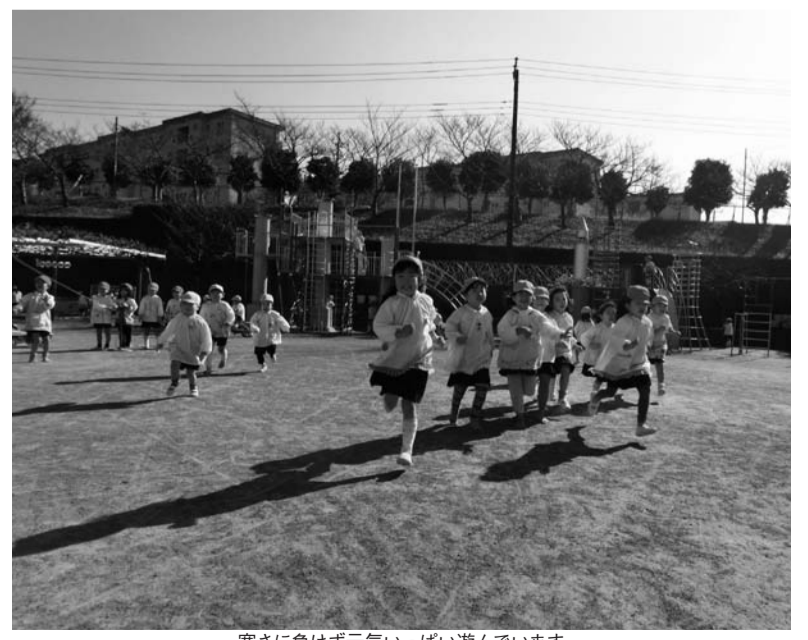
寒さに負けず元気いっぱい遊んでいます

季節が冬へと移り変わり、寒くなってきましたが、幼稚園の園児たちは元気いっぱいです。先生の「お外に行きましょう」の声に、「はい!」と大きな声で答えた園児たちは、急いでカラー帽子をかぶり、園庭に飛び出していきます。そして、園庭遊具や砂場、三輪車や自転車、縄跳び、ボールなどいろいろな遊びが始まり、楽しそうな声が響き渡ります。