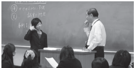
「保護者対応」指導者とのロールプレイの様子

内容は、「小学校の役割と教師の使命」から「教科の指導」「学級経営」「教育の課題」「家庭との連携」まで、これから教員になって学生が遭遇するであろうテーマが中心になっています。教授陣は、教職実践センター全員がチームを組んで対応しています。 昨年十二月十二日(木)には、教員になってすぐに対応することになる「学級通信の作成」「保護者との対応」をテーマに演習が行われました。 授業後の学生の感想には、「先輩の話をうかがって、これからすぐにでも学級通信を作りたいと思いました」「保護者対応のロールプレイをしました。保護者への対応はいままで不安に思っていました。なんとかやれそうな気がしてきました」というものがありました。