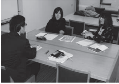
当センターでエントリースシート作成に取り組む学生たち

聖徳ラーニングデザインセンターでは、「夢実現プロジェクト」と連携し、大学三年生、短大一年生の就職活動のためのエントリースシート添削、就活アドバイスを行っています。具体的には、エントリースシートの問題点、文章上の不備などを指摘し、再度書き直してもらいます。こうしたキャッチボールを一人の学生に対し、三〜五回程度、繰り返ししていきます。十二月以降、約五十名の学生とこうしたことに取り組んできました。 今回は、エントリースシートの指導をしていて、気づいたことなどを整理しておきます。次年度就活を控える学生の皆さんには、ぜひご一読をお願いいたします。 エントリースシートを作成するために、学生時代を振り返り、自分の強み・弱みを分析したり、自分に適した業界・職種を探していかなければなりません。こうしたことを根気よく行ったら、通過するエントリースシートに求められるものは、具体性と一貫性です。責任感、正確性、協調性、柔軟性、ストレス耐性など、伝えたい内容に関して、採用担当者が納得するエピソードを具体的に書いてほしいということなのです。 実際に自分が経験したこと、学んだこと、および成果、獲得したノウハウなどを、一貫性をもって伝えていかなければなりません。しかし、実際には、「アルバイトを休まず続けたので責任感があります」という抽象的な表現に止まっていたり、冒頭で責任感を伝えるつもりが、最後はコミュニケーション力であったり、文章に一貫性が欠ける傾向にあります。そこで、さまざまな切り口から質問をして、具体的なエピソードと一緒に探し、その書き方、表現方法を指導しています。 いま、エントリースシート作成にあたり苦戦しているのは、文章力と具体的なエピソードが浮かばないという二点です。ここを乗り越えるためには、簡潔に書く、単語ではなく文で伝える、そして日々の学生生活における振り返りの習慣が重要です。学生の皆さんには、特に次のことを準備しておくことをお勧めします。