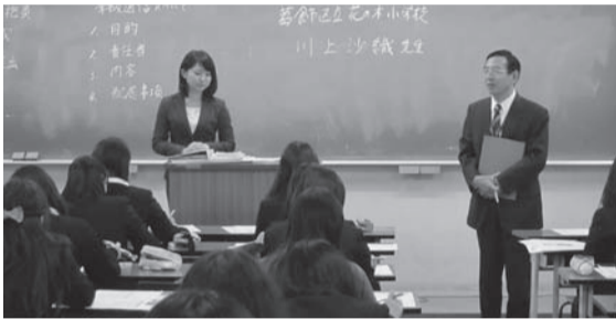
「学級通信の作成」ゲストティーチャー・卒業生の現職教員による説明

今年度から、新たに四年生対象に「教職実践演習」の授業が行われています。今までの教職科目、教育実習の総まとめとしての授業です。 内容は、「小学校の役割と教師の使命」から「教科の指導」「学級経営」「教育の課題」「家庭との連携」まで、これから教員になって学生が遭遇するであろうテーマが中心になっています。教授陣は、教職実践センター全員がチームを組んで対応しています。 昨年十二月十二日(木)には、教員になってすぐに対応することになる「学級通信の作成」「保護者との対応」をテーマに演習が行われました。 授業後の学生の感想には、「先輩の話をうかがって、これからすぐにでも学級通信を作りたいと思いました」「保護者対応のロールプレイをしました。保護者への対応はいままで不安に思っていました。なんとかやれそうな気がしてきました」というものがありました。