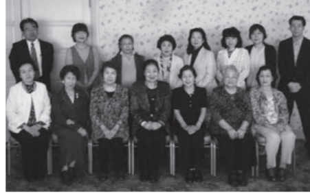
昨年5月の役員・支部長研修会

聖和会は、本学通信教育部の短期大学部、大学院の同窓会で、現在四千八百名の会員で活動しています。本会は総会と役員・支部長研修会を年度により交互に開催しており、また首都圏の支部においては支部会を開催しています。本年度については、昨年の五月に役員・支部長研修会を開催しました。研修会では、今年度の事業計画や予算についての審議が行われ、また各役員・支部長一人ひとりから現状報告をいただきました。研修会後の懇親会では、楽しく親交を深め、次回総会での再会を誓って終了となりました。 また、秋期には、在学生支援のための学習ガイダンスと学生募集のための説明会を、事務局職員に協力いただき開催しました。東京支部では一月に支部会を開催し、同窓生同士の交流を深めることができました。 平成二十六年度は総会を開催する年となっており、夏期に開催する予定です。同窓生の親睦、在学生への支援と共に、通信教育部と学園のさらなる発展に向け、今後も活動を続けてまいります。