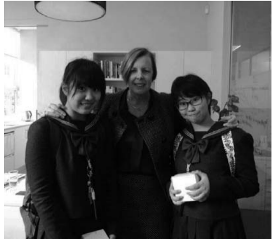
MLCの校長先生と一緒に