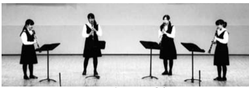
クラリネット4重奏