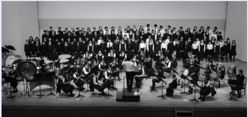
聖徳大学川並香順記念講堂にて

年が明けて間もなく、一月十一日(土)に行われた「吹奏楽の夕べ」では、本校からは吹奏楽クラブと二・四年生による合唱団が参加しました。本年度の吹奏楽クラブは、校内でのミニコンサートやアンサンブルコンテストへの参加など、新たな試みを行ってきました。それも教師にやらされるのではなく、自分たちでやることを決めた行事ばかりです。そのためか、例年よりも明らかに進んで練習する様子が見られました。その成果は想像よりも早く演奏面に表れ、「昨年は、こんなに音は鳴らなかつた」と講師の先生も驚いていました。