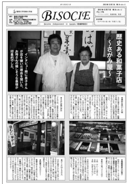
優勝グループが制作したBISOCIE新聞

キャリア教育の一環として、総合文化学科では一年生後期にBISOCIE新聞制作を行っています。キャリア支援室協力のもと、昨年十二月七日(土)に第八回「BISOCIE新聞」コンペティションが開催されました。今回は、学園創立八十周年に当たること、本学短期大学部が文部科学省の「地(知)の拠点整備事業」(大学COC事業)に採択されたことから、「80」松戸の二つをキーワードに制作されました。