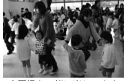
在園児と一緒に楽しみます

毎年二月上旬ごろに、来年度幼稚園に入園される親子を対象にした、「一日入園」が行われます。