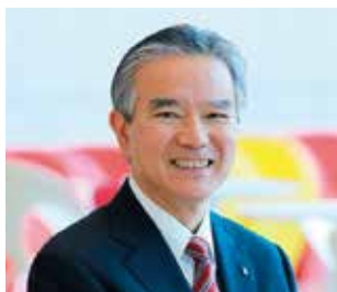
聖徳大学・聖徳大学短期大学部 理事長・学長