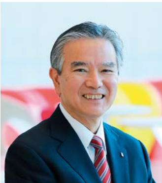
聖徳大学・聖徳大学短期大学部 理事長・学長