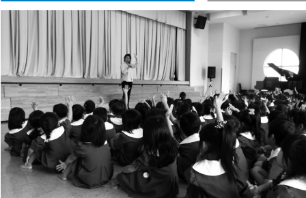
先生のお話に元気に応える子どもたち

ていました。そのあとは花火大会に移り、パーンという音と光に合わせて幼児の歓声が鳴り響き、手をたたき、友達と花火を指さして喜び姿も見られました。八時半の就寝時間にはなかなか寝つけない幼児もいましたが、十時半過ぎにはさまざまな寝方ですべての幼児が寝つきました。幼児の寝顔はとて愛おしく、夜中に見回りをした教師は笑みを浮かべながら、一人ひとりのタオルケットを掛け直していました。起床時には「おはよう」と、友達の間をゆすって起こす姿もあり、親元を離れ、一晩過ごせた自信に満ちあふれた幼児の笑顔が見られました。このお泊り会は、家族と離れた共同生活経験を通して、友達と協調する喜びや大切さを味わい、自分の事は自分でする習慣をつけ、自立を促すことをねらいとしています。普段から何でも自分で取り組み、意欲を持てるよう指導しており、このお泊り会でも幼児の自発的な行動が見られました。また、お泊り会での幼児の姿を写真にとり、すぐにホームページに掲載しまし