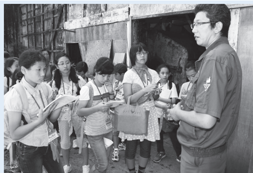
取材中の目は記者そのもの

八月四日(月)から七日(木)にかけて、宮城県石巻市にて開かれた第四十八回まめ記者講習会(神奈川県私立小学校協会新聞研究会主催)に、附属小学校の児童七名が参加しました。「新聞作りを通して子どもたちの創造性を高め、他校の仲