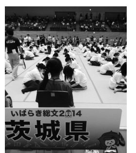
いばらき総文2014 茨城県

見られ、一・二年生の交流を深めることができました。今後の学習に対するさらなる取り組みと躍進を大いに期待したいと思います。