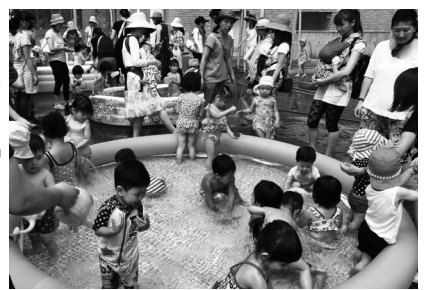
親子で仲良くプール遊び

ルに入ると「わあ、きもちいい!」「つめたーい!」などうれしそうなお声があちこちで聞かれました。バシャバシャと水をかけ合ったり、じょうろで水を汲んで遊んだり、潜ってみたりと、水の気持ち良さを存分に味わったようです。プールの中からニコニコ笑顔で親に手を振る姿や、水をかけても笑ましく感じられました。