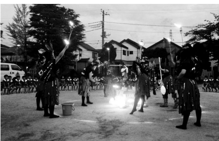
迫力のキャンプファイヤー

を中心に行きます。特に子どもたちに人気のある動物はキリンです。「キリンさんはまつげが長いね」「お顔が可愛いね」など間近で見ることができると、より親しみやすいようです。また足元から見るとキリンの大きさをより実感することができ「やっぱり背が高いね」と園児たちは圧倒された様子でした。その他にも、ダチョウやチンパンジー、ゾウ、フラミンゴ、サーバル、チーターなどを見学し、「こっちに来てくれたー!」見て見て!「すごい」と、どの動物にも釘付けになっています。見学後は、キリンやシマウマの見えるベンチでお弁当を食べ、幼稚園に帰ります。家族で動物園に来ることもある園児たちもいますが、友達と一緒に動物園はまた特別違うようです。園外保育は園児たちにとって楽しみな行事の一つです。