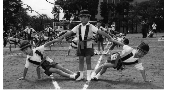
グラウンドは大盛り上がり

入場行進では、胸を張って手を大きく振って元気に入場してきます。準備体操は、子どもたちの大好きな「たけのこ体操」を元気よく行い、その後全園児のかけっこを行います。最後まで一生懸命走ろうとする年少児、まっすぐ前を見て腕