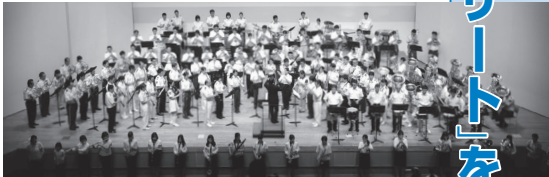
コンサートの様子

この研修会には、全国の都道府県警察本部にはそれぞれ音楽隊が編成されており、交通安全パレードやコンサート活動等で活躍されております。