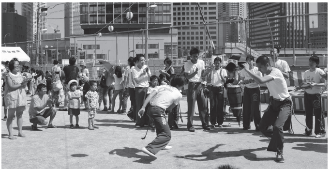
アクロバティックな動きに大きな歓声