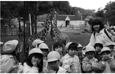
キリンさんと一緒に

を一生懸命振って走る年中児、友達と競争心をもって走る姿が真剣な年長児と、学年の差がよくあらわれます。遊戯では、学年ごと、広いグラウンド一杯に自信をもって体を動かし、元気を