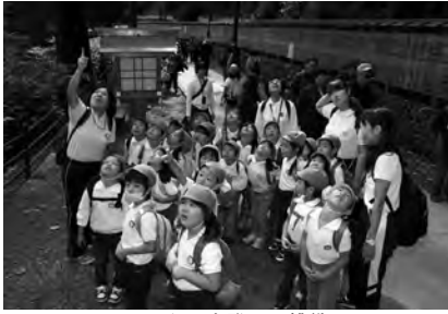
みんなで山登りに挑戦