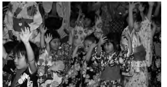
色とりどりの浴衣の園児たち

八月二日(金)、多くの方々の参加の中、「盆踊り会」が行われました。暑い夏の風物詩であります。