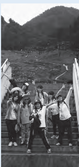
いざ、森林セラピーへ

Tel:03-5476-8811 Fax:03-3476-8820 Mail:senmon@seitoku.ac.jp