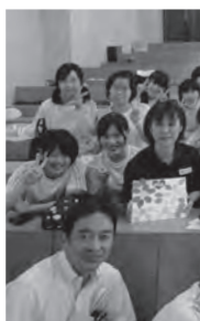
にぎやかな食卓になりました

三日間の厳しい講習をやり遂げた生徒たちの顔には、達成感が満ちあふれていました。この講習で学んだことが生徒一人ひとりの将来への第一歩につながるものになれると思います。