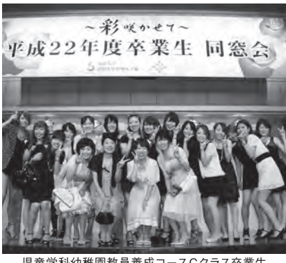
児童学科幼稚園教員養成コースCクラス卒業生

謝恩会で予定していた「彩(いろ)咲かせて」のテーマを掲げ、帝国ホテルでの同窓会を実現させました。 当日は、卒業生三百九十九名、来賓・教職員を含め計百三十三名、総勢五百三十二名の出席があり、盛大な会となりました。学生