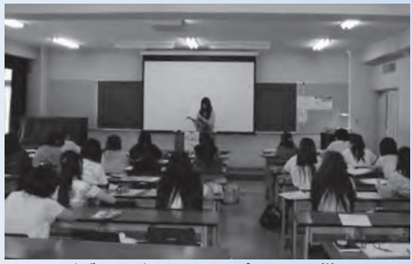
ビブリオバトルによるプレゼンの様子

私の専門分野は、キャリア教育です。具体的には、学生の社会との円滑な接続、キャリア形成支援が主な役割で、特にキャリア教育に効果の高い学習プログラムとはどのようなものを研究しています。 二〇一三年度前期の「キャリア総合演習」の授業では、保育科の学生とビブリオバトルに挑みました。ビブリオバトルとは、各自が自分の薦める本を一冊選び、その内容について皆の前でプレゼンテーションを行い、最後に最も読みたくなった本に投票するというものです。この度は、保育科ということもあり、絵本に限定してクラスごとに行いました。