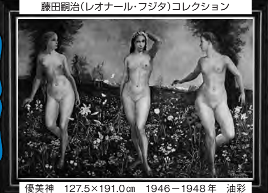
藤田嗣治(レオナルド・フジタ)コレクション 優美神 127.5×191.0cm 1946-1948年 油彩

学園創立80周年を記念し、本学の所蔵コレクションの中から貴重な名品を特別に公開します。本学所蔵コレクションは、本学が教育理念の一つとして推し進めている「実物教育」の一環として活用するために、主として文学、音楽、美術、工芸等に関する実物資料、文献等を国内のみでなく、諸外国からも収集し、保管しております。 記念展では、わが国を代表する画家である藤田嗣治の作品「優美神」、本年が生誕200年にあたるリチャード・ワーグナーが作曲した歌劇「タンホイザー」の自筆楽譜、わが国独自の伝統的な画法である大和絵の画風で描かれた絵巻「竹取物語絵巻」、重要無形文化財保持者(人間国宝)の陶磁器など、さまざまなジャンルの名品を各コーナーに分けて展示公開します。