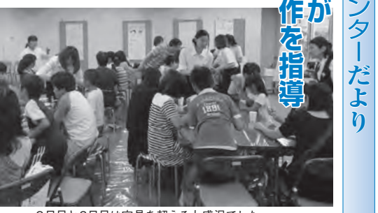
2日目と3日目は定員を超える大盛況でした

櫻井ゼミの学生らが夏休み子供理科工作を指導 伊勢丹松戸店主催 八月三日(土)から五日(月)の三日間、伊勢丹松戸店九階の手作りコーナーで、三年生の櫻井ゼミの学生八名他が理科工作教室を指導しました。連日の猛暑にもかかわらず、幼児から児童・生徒、保護者で会場がいっぱいになりました。