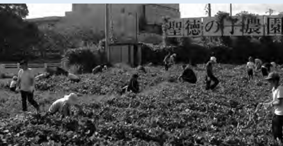
緑生い茂る聖徳の子農園

引き続き、十一月十六日(土)・十七日(日)にひたちなか市文化会館で開催される「第二十七回茨城県高等学校演劇祭」(県大会)に出場します。 また、来年度は茨城県で「全国高等学校総合文化祭」が開催されます。今回の県大会は全国大会のプレ大会ということもあり、例年よりも大がかりな大会となりますが、女子生徒だけで演じるハンディを乗り越え、より良い舞台を仕上げてまいります。