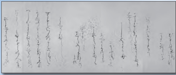
① 岩井秀樹先生「中務(なかつかさ)のうた」(卷子・部分)