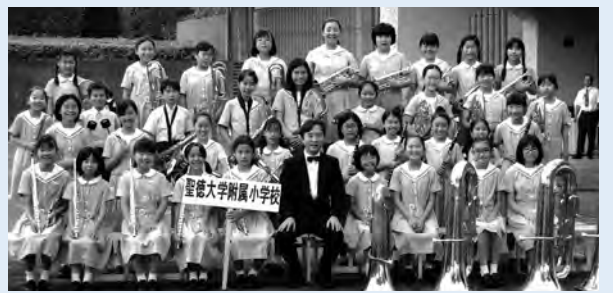
もう少しで金賞という順位に見事な活躍ぶり!!

七月二十七日(土)に行われた千葉県吹奏楽コンクールに、附属小学校吹奏楽クラブが参加しました。千葉県は、参加団体数・演奏レベルともに全国有数の激戦区です。土日も休み返上で練習している他校と比べ、本校は毎朝わずか三十分ほどの短い時間の中で練習を進めなければなりません。 今回はあえて「金賞をめざす」ことをせずに、普段の活動で培った力を出し切れるように「自己ベストをつくす」ことを目標に練習に励んできました。ここでいう普段の活動とは朝練習のみならず、普段の音楽の授業や日常の生活のことを指します。コンク