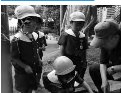
一粒一粒大切に時きました

一粒一粒大切に時きました。イからポットへの移植を行い、三年後の植樹の時にはどのくらい成長しているのか園児と背比べするのが楽しみです。長期の継続的な活動になります。園児たちが育てたタブノキが浦安の森を創ることを夢見て取り組んでいきます。