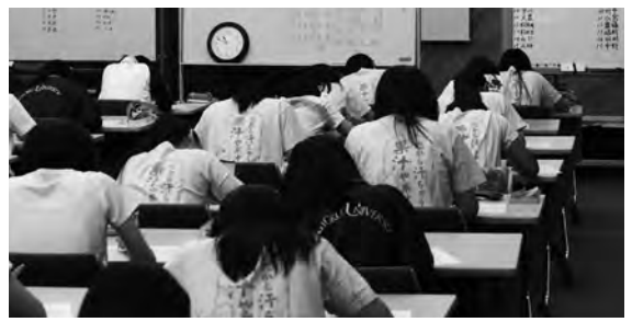
茨城県守谷市の「セミナーハウス常総」にて

八月二十日(火)から三泊四日の日程で、夏期学習合宿が行われました。本校の学習合宿は、「1.学習習慣の定着と基礎学力の育成を図る。2.大学入試に向けた応用力・実践力を養成する。3.共同生活を通じて同じ目的を目指す者同士の意識高揚と学習意欲の向上を図る。」ことを大きな目的としています。 今回で十九回目となる合宿には、四年・五年生より九十九名が参加し、一日に六十分×九回の集中授業を四日間にわたって行いました。特に初日の夜は、毎日行っている英単語テストの総まとめを深夜まで行いました。四年生は初めての体験に戸惑いながらも懸命に取り組む、五年生は一年半の学習の成果を先輩に示すことができました。 この四日間の合宿は、年々競争が激化する難関校を目指す生徒たちの真剣かつ緊張感が伝わる雰囲気になっていました。