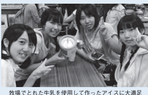
牧場でとれた牛乳を使用して作ったアイスに大満足