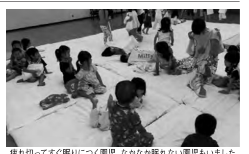
疲れ切ってしまう園児、なかなか眠れない園児もいました

夕暮れになり、園庭に集まると、太鼓の音に合わせてインディアンが登場してきました。インディアンは「なかよしの火」を持って来て、薪に火を灯してくれました。突然のインディアンの登場や炎にびっくりしていた園児もいましたが、初めてのキャンプファイアに興奮していたようです。炎を囲み、歌ったり、先生たちの「おおかみと七ひきのこやぎ」の劇を見たりして、楽しいひとときを過ごしました。炎が消されると、待ちに待った花火大会の始まりです。「きれーい」「すごい」と歓声をあげていました。そしてパジャマに着替え、ホールで就寝しました。