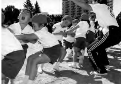
綱引きで会場は大盛り上がり