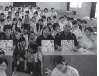
日本赤十字社の先生方を囲んで

八月七日(水)から九日(金)まで、高校生を対象に日赤救急法講習会が本校で行われました。今年度は七十名近くの参加希望があり、その中から定員枠五十名の中に選ばれた生徒たちが日本赤十字社の先生方のご指導のもと、講習に励みました。