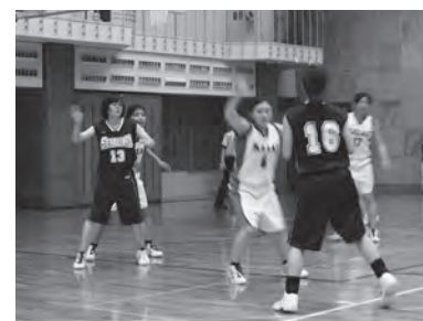
千葉県女子学生バスケットボールリーグ戦

大会より期待のAリーグに所属することを果たしたもので、関東大学女子バスケットボールリーグ戦においても、四部から三部への昇格を目指してほしいという願いを込めて開催されました。