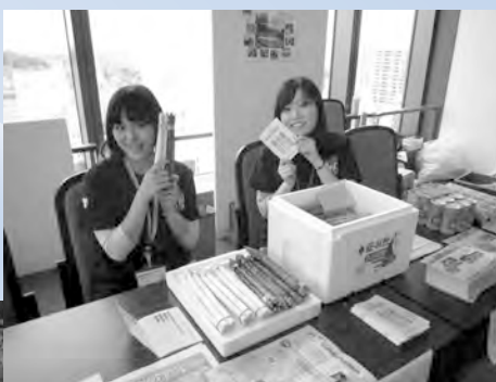
「楽習フェスタ2011」で被災地の野菜を販売(6月)

若者たちの地域離れが指摘されて久しくなります。三月十一日の東日本大震災は、日本中に想像を絶する不幸をもたらしましたが、その中で、数々の日本人の優しくたくましい姿を世界に示すことになりました。その一つに、コミュニティが多くの人々の命を救ったことも報じられました。多くの若者たちが、献身的に被災地でボランティアとして活躍している様子も伝わっています。こうした活動は、若者たちが地域に帰ってきたという兆候を示しています。ふるさとを取り戻そうという意識を、あらためてよみがえらせたといえるでしょう。