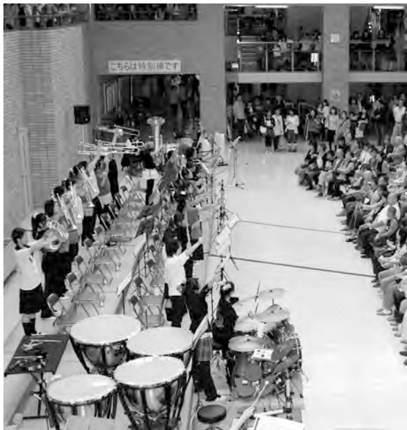
吹奏楽部演奏風景

九日(日)に開催され、盛況の内に終了しました。今年度の聖徳祭のテーマは、『Move』心を動かす刻め歴史を』でした。今