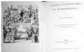
「不思議の国のアリス」 初版1866年