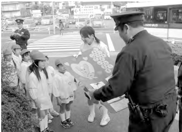
おまわりさんに感謝の気持ちを届ける園児たち

園内の感謝 の集いでは、 教職員に各ク ラスで作った プレゼントを 渡します。日 ごろお世話に なっている方 にあらためて お礼を伝える ことで、さま ざまな人に支 えられて毎日 過ごせている ことのありが