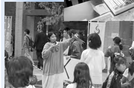
「松戸まつり」でキッズスクエアの遊具運営をサポート(10月)