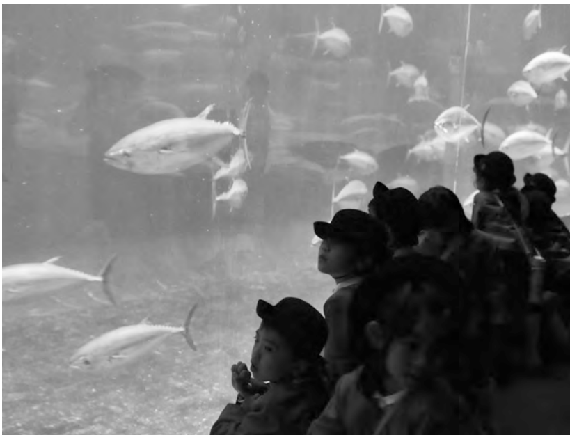
悠然と泳ぐマグロに圧倒される園児たち

水族園に入ると、まず園児の目を引いたのは、銀色に輝く体で大きな背びれ、胸びれを動かしている、大きなマグロでした。また、