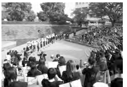
多くの観客が集まる中、SHAN SHANプラザで行った開会式

初めて屋外のSHAN SHAN ANプラザで実施した開会式をはじめ、松戸西口商店街と協力して地元特産品を販売した「出張商店街(NETWORK)」、卒業生を招いて行った「Happy Home coming」、「クイズラリー」