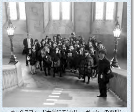
オックスフォード大学にて(ハリー・ポッターの再現)

ダンスに酔いしれました。今回の海外研修を通して、イギリスの文化を学ぶことができました。海外研修に参加させていただいたことに感謝し、この経験をさまざまな場面で生かしていきたいと思っています。