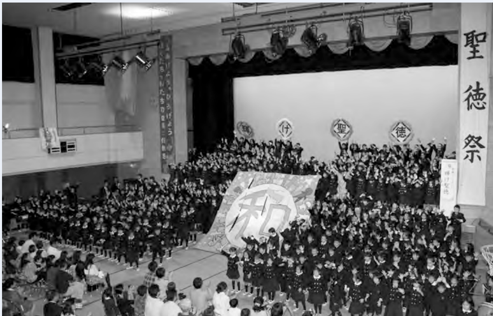
全校ページェント