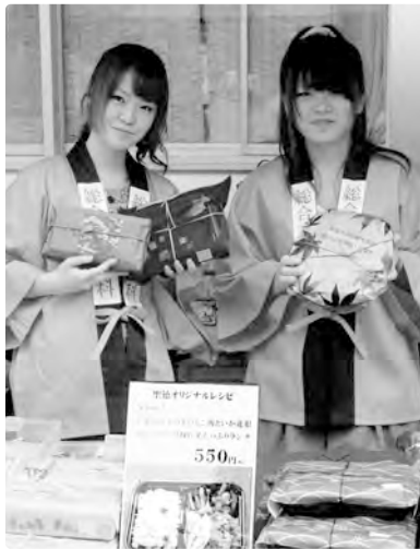
総合文化学科の学生が販売も協力しました