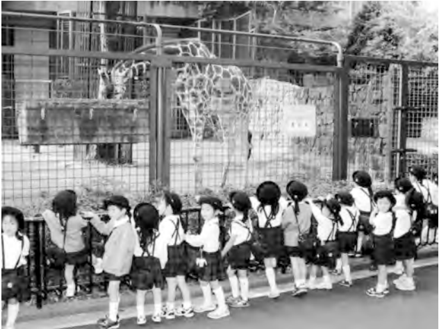
キリンの食事を見学する園児たち

動物園に 到着すると 園内は、他 の幼稚園、 小中高生の 団体や一般 客で大にぎ わいでした。 安全面はも ちろんのこ と、絶対に 迷子を出す ことのない よう引率に は大変気を 配りました。 一番最初 に見た動物は、人気のジャ イアントパンダでした。「パ ンダちゃん、まだ寝てる の? おはよう!」と話し かけたり、キリン、ペンギ ン、かば、エミューなどい ろいろな動物を間近で観察