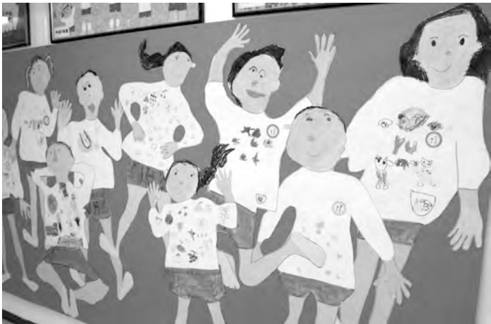
自分の等身大が大集合

十一月二十八日(月)、多 摩中央幼稚園では作品展が 行われました。四月から園 児たちが作った作品や絵画 を保育室や廊下に飾り、幼