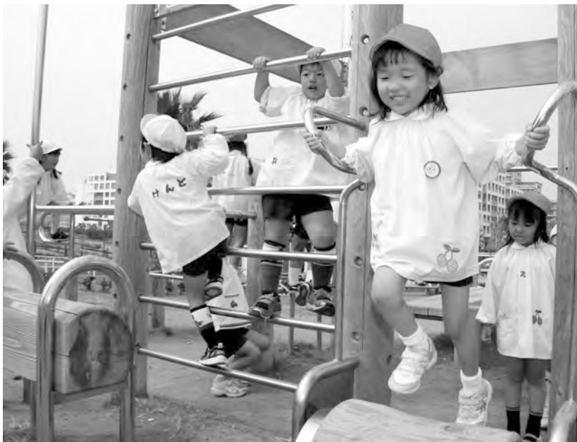
アスレチック遊具で大はしゃぎ

秋の自然に親しみ、先生や友達と一緒に遊びながら、公衆道徳や交通のルールを守る体験をした一日となりました。