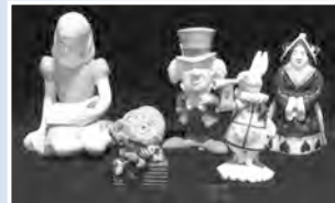
フィギュアコレクション