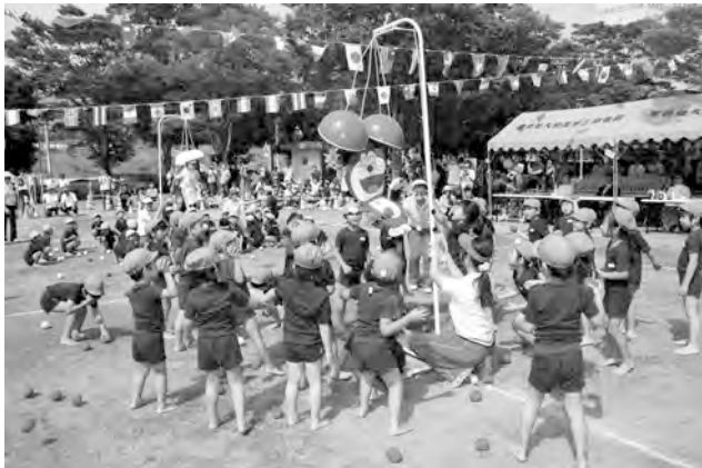
みんなで力を合わせた鈴割り

やさしく声をかけてもらっ たり、モノレールに乗った りと楽しい時間は瞬く間 に過ぎました。幼稚園時代 の楽しい思い出の一ページ として心に刻まれること でしょう。