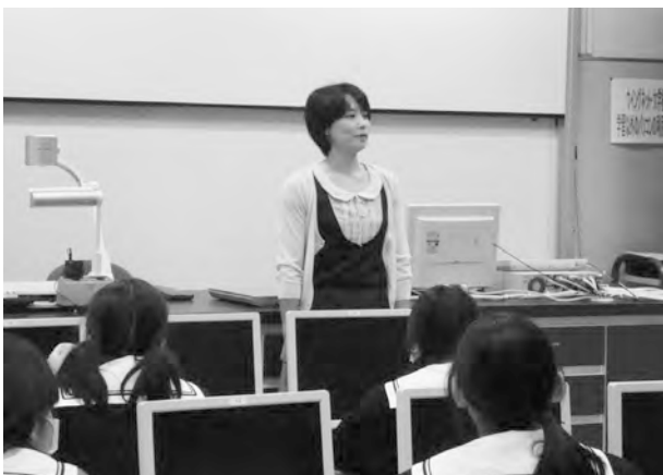
熱心に耳を傾ける生徒たち

保護者の方々の愛あふれるメッセージに、生徒たちはただただ感動の涙を流しておりました。きっと、自分が宝物であること、そして周りのみんなも宝物であることを感じてくれたことと思います。「自分を、そして仲間を大切に、有意義な学校生活を送ること」、これが共通する親の願いです。1年生の皆さん、今日のこの日を忘れず、精いっぱい生きていきましょう。それが一番の親孝行です。以下、生徒たちの感想を一部紹介します。