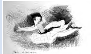
「マリー・ローランサン挿絵」 1930年

「不思議の国のアリス」は、イギリスで出版されてから140年以上がたっていますが、今でも子どもから大人まで世界中で親しまれている、児童文学の古典となっている作品です。今回は資料の他にジオラマも展示しています。この機会に「不思議の国のアリス」の世界をぜひご覧ください。