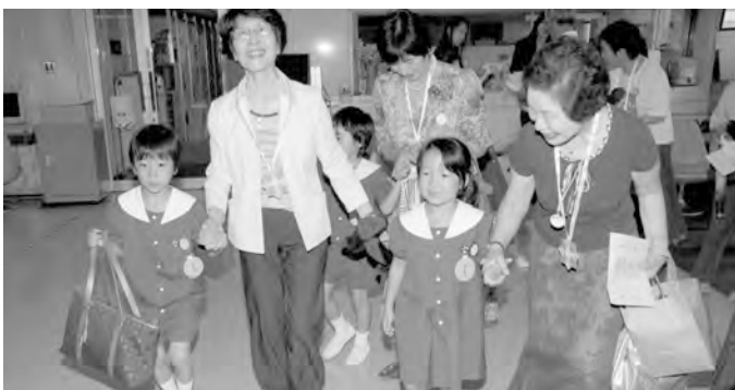
会場へ案内をする園児たち

敬老の日になみ、毎年 九月に園児の祖父母をお招 きして敬老の日の集いを行 っています(今年度は九月 十七日(土)に行いました)。 最初に、学年ごとの歌や合 奏・遊戯をご覧いただき、そ の後、各クラスで手遊びや フォークダンスをして遊び ました。