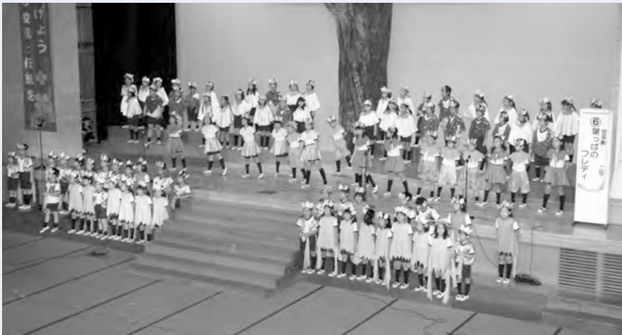
2年生が演じた「葉っぱのフレディ」

他にも、二年生による音楽劇「葉っぱのフレディ」では、四季の美しい変化を舞台で表現するなど、今年の聖徳祭も大盛況のうち幕をおろしました。