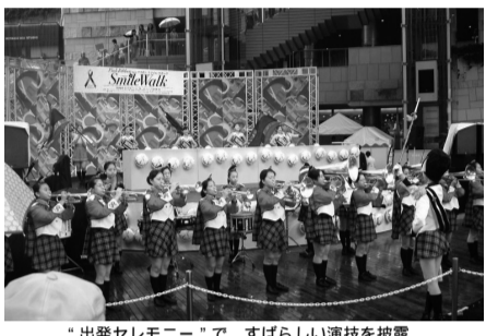
「出発セレモニー」で、すばらしい演技を披露。

聖徳大学・聖徳短期大学部では昨年に引き続き、ピンクリボンキャンペーンに協賛し、十月十日(祝月)