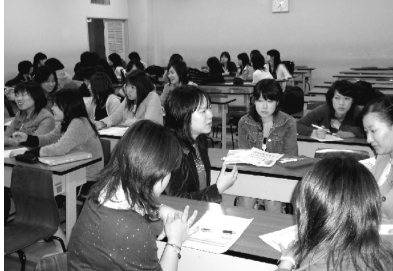
平成17年10月24日(月) 企業就職支援特別講座「就職活動の実態(先輩と語る)」(約350名が参加)