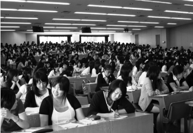
平成17年9月19日(月) 幼稚園・保育園・施設系就職セミナー(約1,000名が参加)

職員一同、何よりも学生の将来の幸せを願い、また、就職実績が、学園を支援いただいている皆様への恩返しであること、学園の将来を占つ職務と捉え、日々の業務と勉学に精進する所存です。より一層のご支援をお願い致します。