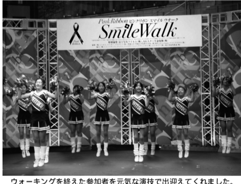
ウォーキングを終えた参加者を元気の演技で出迎えてくれました。

このウォークイベントの参加を通じて、楽しみながら乳がんへの関心を高めたい。ただ、多くの人の目にピンクリボンが触れることで、乳がんの早期発見・早期診断・早期治療の重要性が伝わることを願っています。