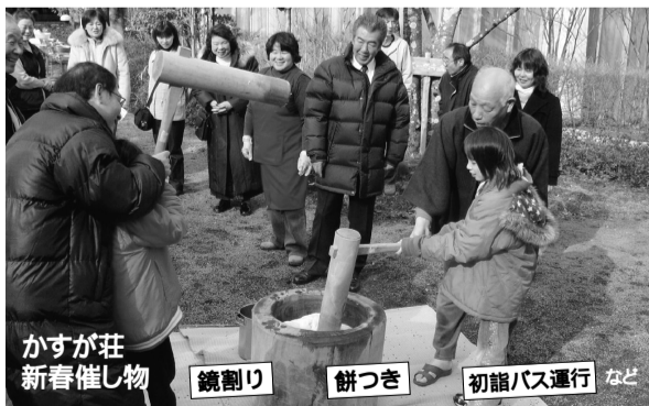
かすが荘 新春催し物 鏡割り 餅つき 初詣バス運行 など 詳細は現地フロント(0267-52-2111)までお問い合わせください。

かすが荘の新年は、恒例の鏡割りに始まり好評の餅つきなどお正月の催し物が目白押しです。昔ながらの日本の風物詩であり、都会ではなかなか体験できないことではないかと思いませんか。どうぞ、ご家族、ご友人お揃いでかすが荘へお越しください！かすが荘料理人自慢のおせち料理と共にみなさまをお待ちしております。